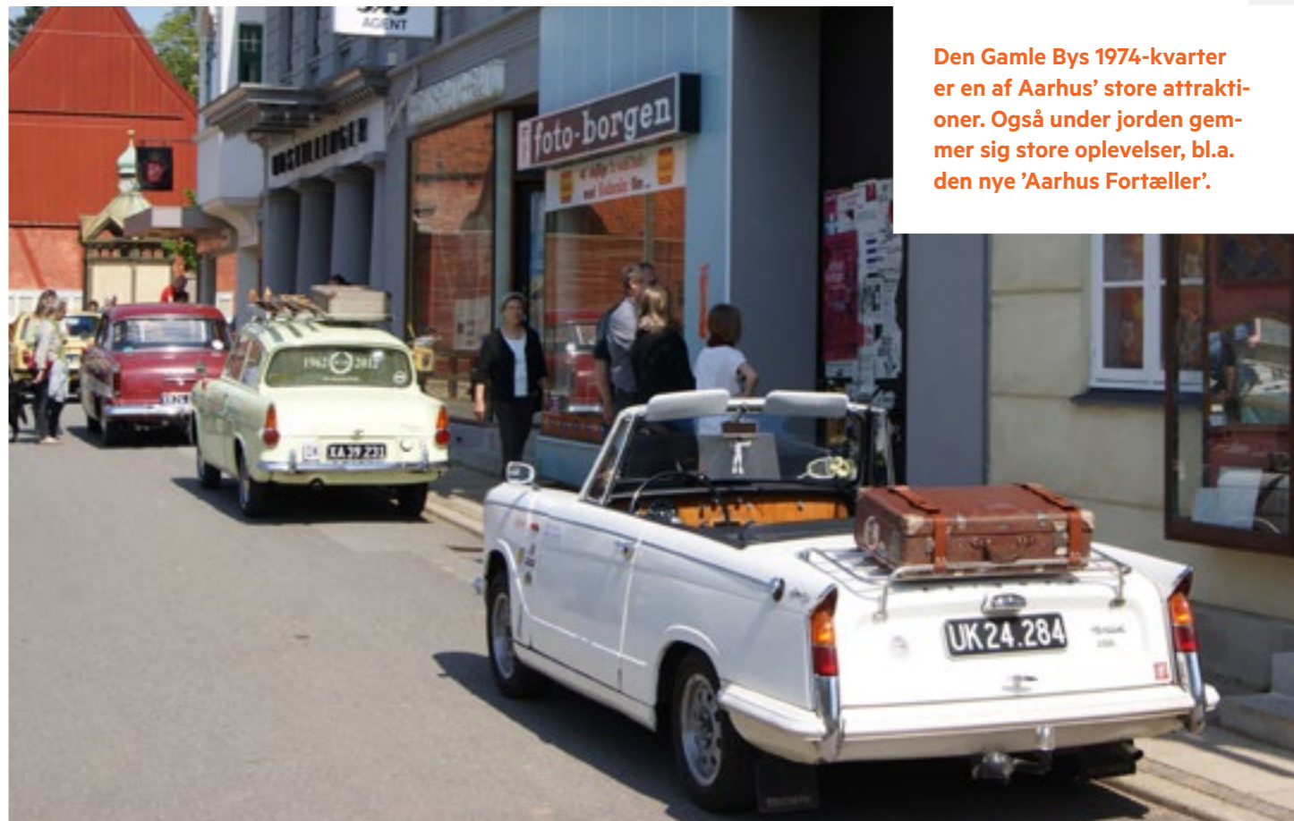
Den Gamle Bys 1974-kvarter er en af Aarhus' store attraktioner. Også under jorden gemmer sig store oplevelser, bl.a. den nye 'Aarhus Fortæller'.

I 1709 stod den svenske hær ved byen Poltava i Ukraine. Den Store Nordiske Krig – initieret af Sveriges stormagtsdrømme – havde raset i ni år, men slaget ved Poltava blev krigens vendepunkt. En ny Østersø-stormagt begyndte at vise sig: Rusland under Peter den Store. Efter at have sat Danmark og Sachsen-Polen ud af spillet i krigen vendte svenske kong Karl XII sig mod Rusland, og det skulle vise sig skæbnesvangert. Det svenske felttog havde udartet sig til en kamp om at holde arméen i live. Da de to hære mødtes ved Poltava, vandt russerne en ødelæggende sejr. Kun et par tusind mand fra den svenske hær undslap til osmannisk territorium – herunder kongen. Omkring 20.000 mand forsvandt. Kun 4.000 vendte hjem til Sverige, mange først efter mangeårigt fangenskab. En ny stormagt ejede Østersøen.